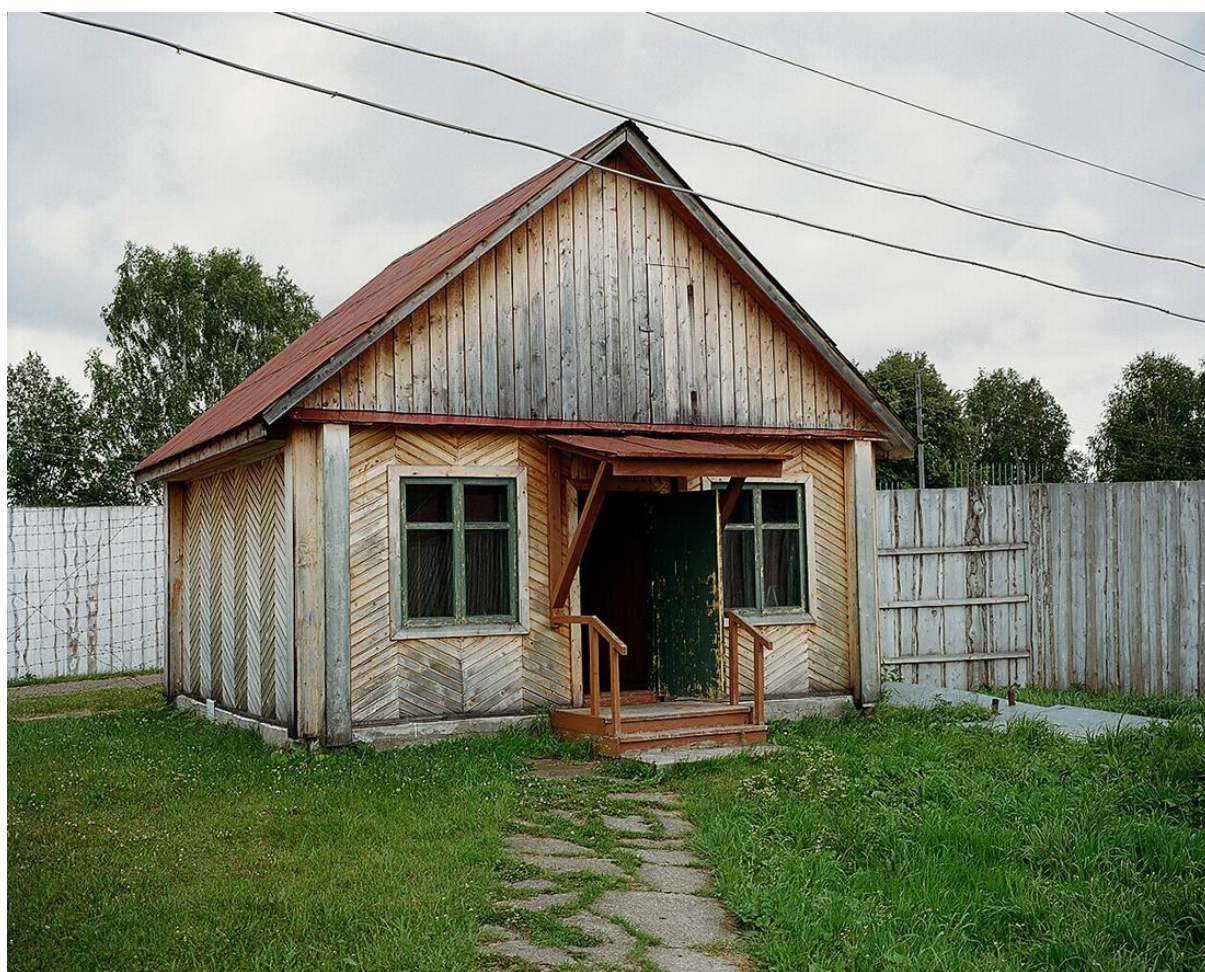
«Шмоналовка» 36-ой зоны

Нас привели на обеденный перерыв из трудовой зоны в жилую, а после обеда должны были вернуть обратно. На трудовую зону мы попадали через контрольно-пропускной пункт, который зеки называют «шмоналовкой», поскольку там нас обыскивали, как при входе, так и при выходе. «Шмон» - обыск на блатном жаргоне.