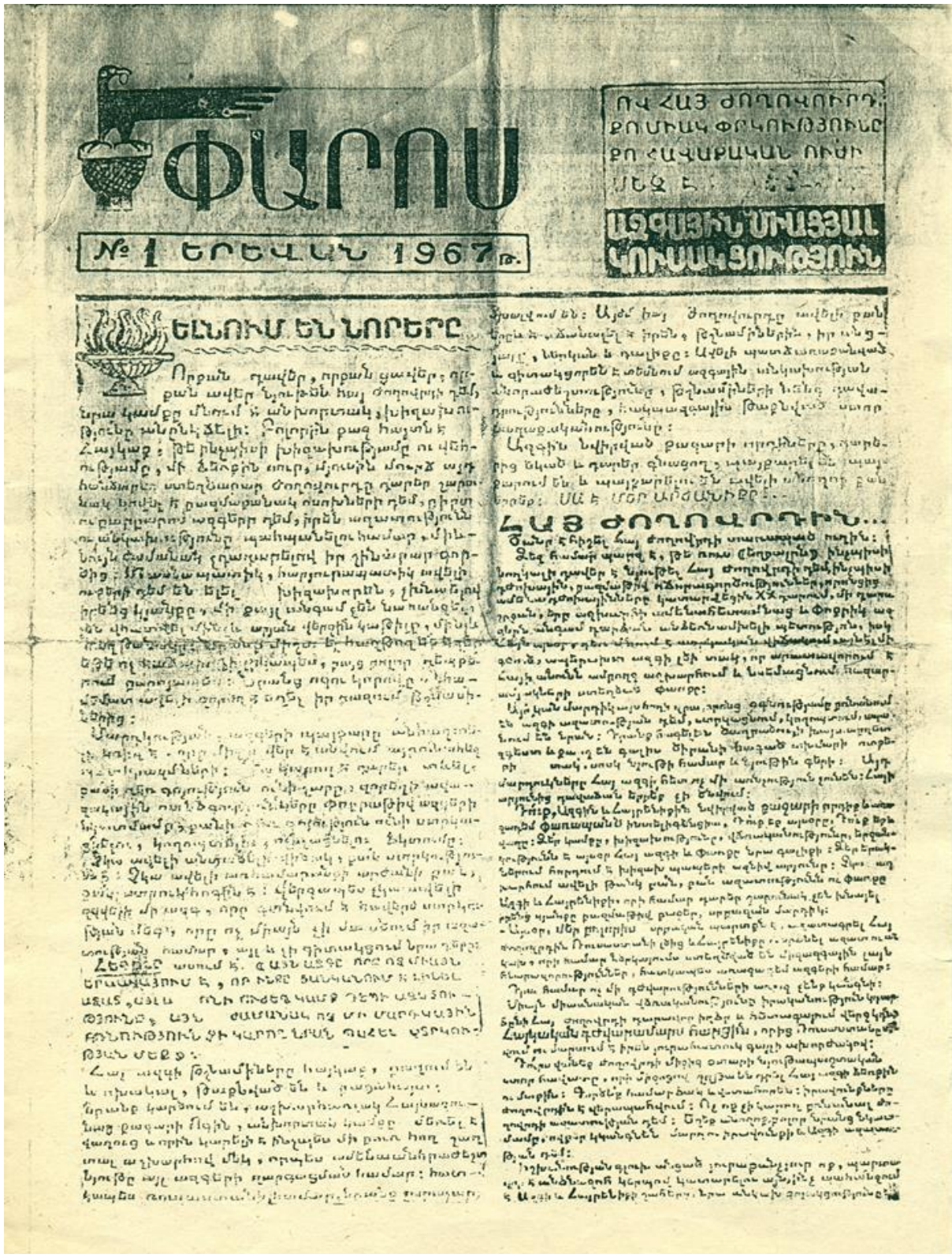
Первая страница газеты «Парос» (Маяк)

обретения независимости эта группа относилась с осторожностью, всячески избегая конкретики в формулировках. Лишь во второй половине 1970-х, опять же, после ареста и освобождения представители этой организации окончательно созрели и поддержали идею независимости.