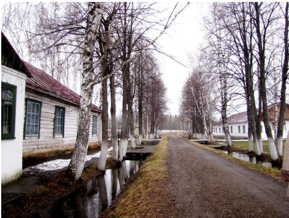
Аллея 36-ой зоны

Новая моя зона существенным образом отличалась от всех предыдущих. Прежде всего, территория этой зоны была намного больше. На территории 36-го лагеря было довольно много строений: отдельная баня, отдельный медпункт, отдельная столовая и так далее. Она отдаленно напоминала, возможно, 35-ю зону, но не могло быть никакого сравнения с первой моей зоной - 37-й. Там была металлообрабатывающая, столярная мастерская, был небольшой цех, в котором изготавливались детали и электрические провода для утюгов. Сама зона находилась на берегу реки Чусовая, поэтому весной там часто случались большие и малые наводнения. Кроме того, в этой зоне было значительно больше людей. И еще одно важное обстоятельство: в жилой зоне существовала самая настоящая аллея из деревьев. Я уже писал о том, что деревья были и в 35-й зоне, но они были отделены от территории зоны колючей проволокой, ими можно было любоваться, прогуливаться рядом, но находиться непосредственно под ними было невозможно. А здесь можно было пройти по аллее до столовой, или медпункта. Мы с удовольствием прогуливались по этой аллее.