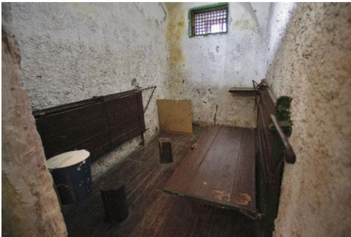
Двухместная камера ШИЗО