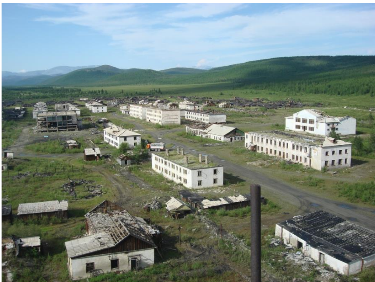
Пос. Буркандья, место моей ссылки. Сегодня там никто не живет, поселок-призрак.