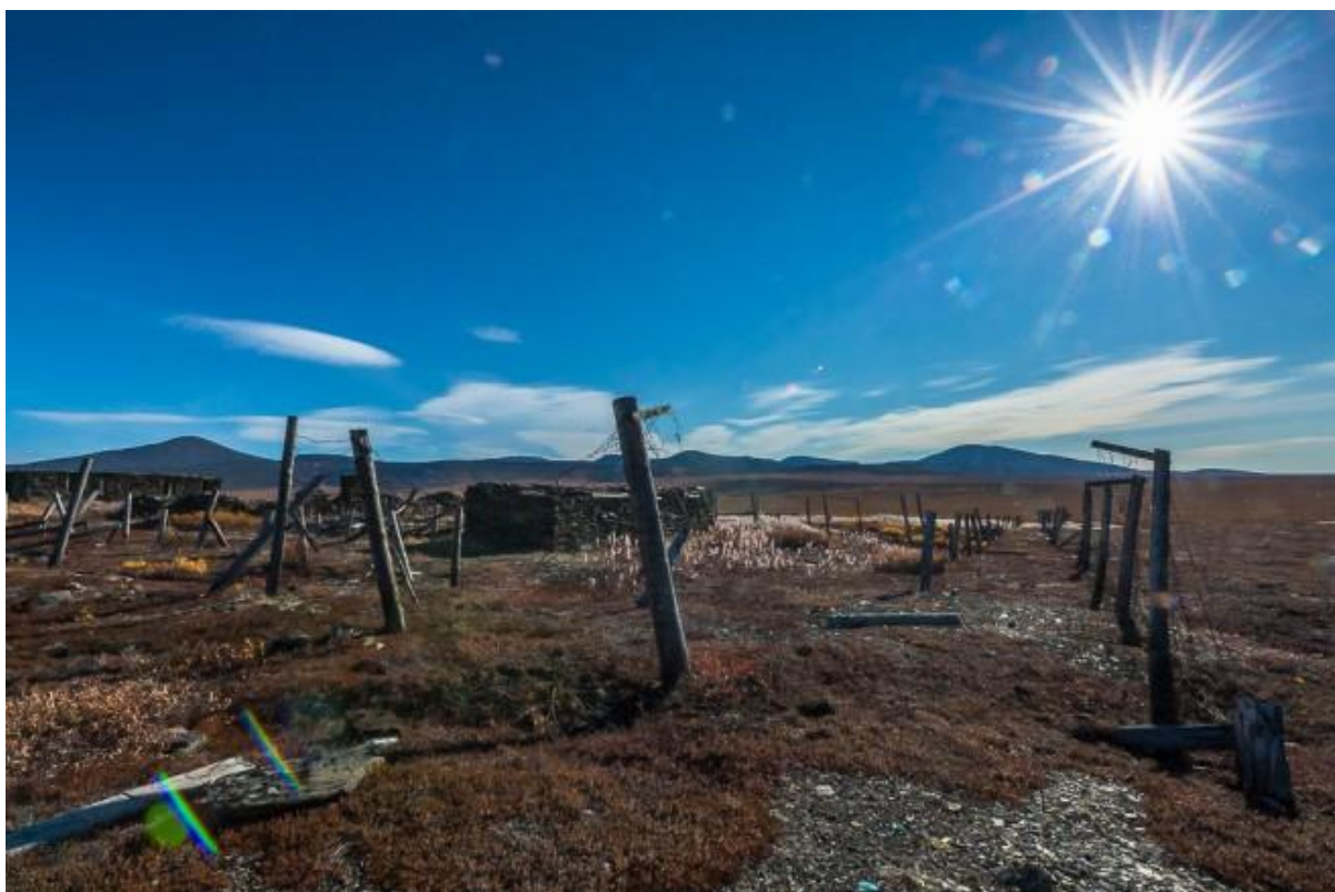
Заброшенная зона в Магаданской области