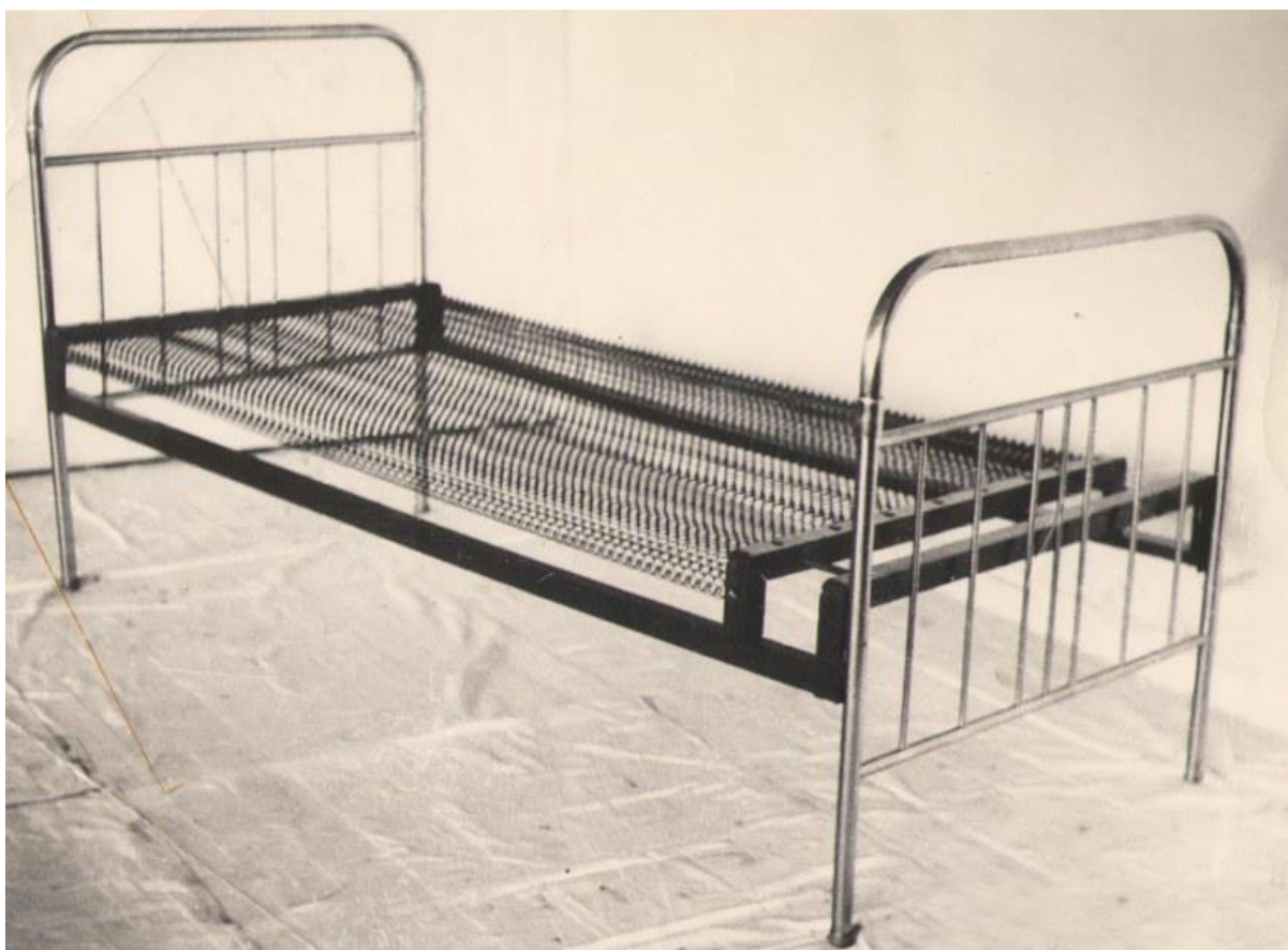
Кровать в бараке

Но каково же было мое удивление, когда после карантина охранник вывел меня из камеры и повел по территории зоны к бараку. Прежде всего меня впечатлила сама территория. Она была не очень большой, но аккуратной и в полной мере просторной для прогулок. Барак удивил меня еще больше. Это было просторное, опрятное, залитое проникающим сквозь широкие окна солнечным светом помещение, в котором в три ряда стояли железные кровати (их было примерно 30), и они были вовсе не такие, на которых приходилось спать в пересылках, а мягкие, с пружинами.