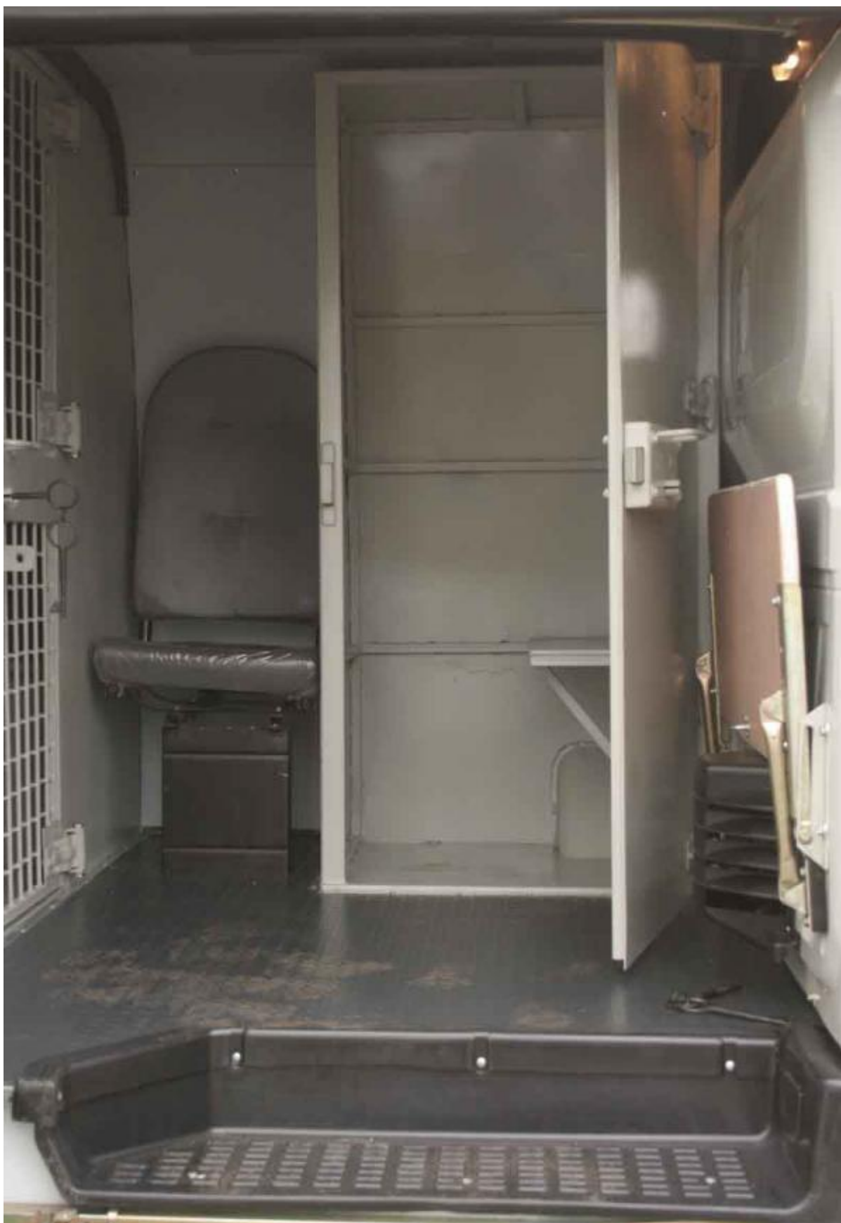
Одиночная камера в автозаке